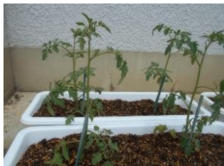
ミニトマトのなえ