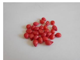
トウモロコシのたね