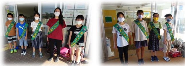
朝から笑顔であいさつ運動を頑張っている児童会本部役員です！