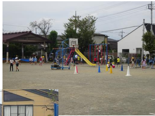
遊具も大人気です！順番を守って仲良く使っています。