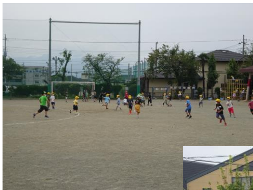
鬼ごっこやサッカーで盛り上がっています！

○また、校庭も休み時間に遊ぶ子どもたちでにぎやかになりました。こういう時にこそ、外で体を動かし、一端気持ちをリセットしてさらに集中力を高めるというサイクルが重要です。外遊びにはたくさんのプラスの要素があります。本校では昨年度より密を避けるための一つの対策として、休み時間を前半と後半に分けて校庭を使用しています。短い時間ですが、思い切り体を動かす子どもたちにたくましさを感じます