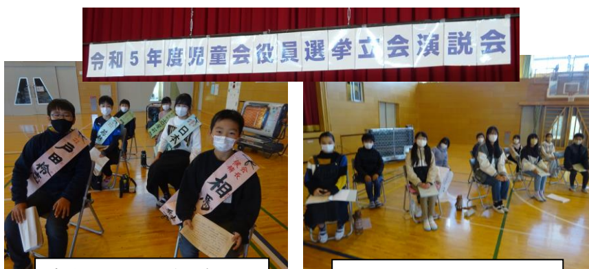
今後の活躍に期待が高まる 6名の立候補者