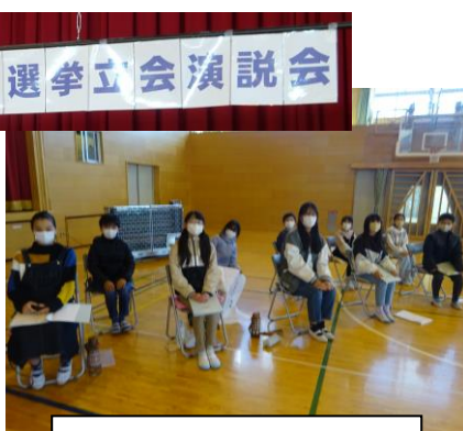
立派に重責を果たしました 選挙管理委員会